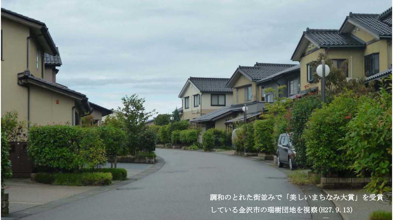
調和のとれた街並みで「美しいまちなみ大賞」を受賞している金沢市の瑞樹団地を視察(H27. 9. 13)