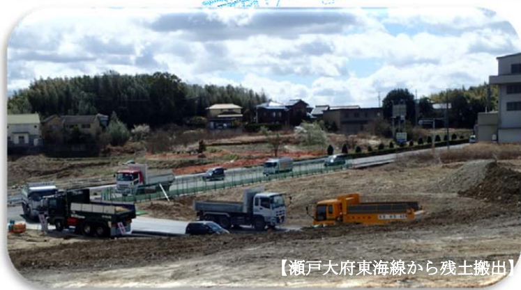
【瀬戸大府東海線から残土搬出】