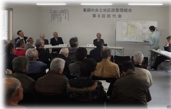
東郷中央土地区画整理組合 第8回総代会