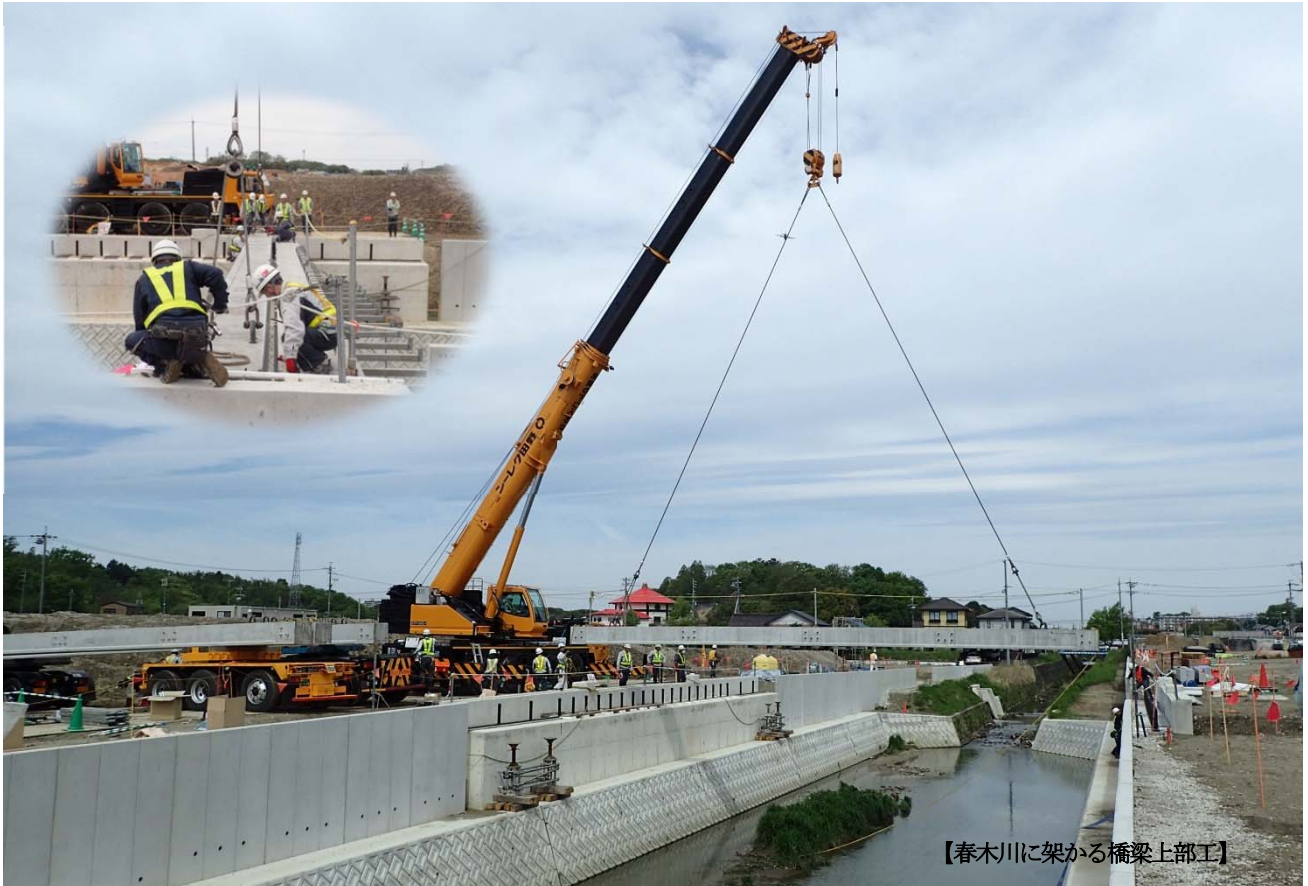
【春木川に架かる橋梁上部工】