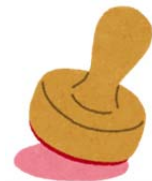
【手数料を徴収する事務の種別及び料金】