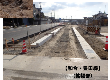
【和合・豊田線】 （拡幅部）