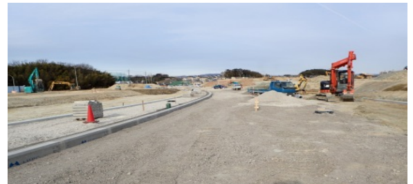
【和合ヶ丘・新池線】 （新設部築造）