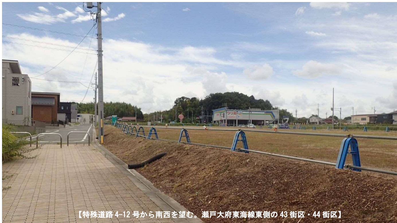
【特殊道路4-12号から南西を望む。瀬戸大府東海線東側の43街区・44街区】