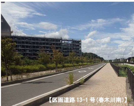
【区画道路 13-1 号(春木川南)】