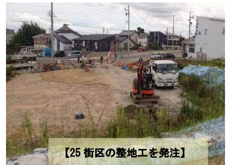
【25 街区の整地工を発注】