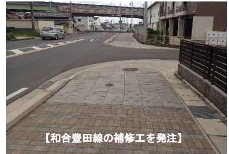
【和合豊田線の補修工を発注】