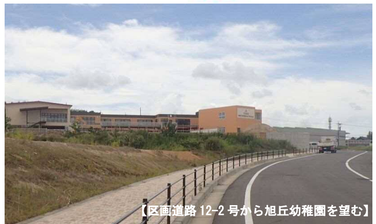
【区画道路 12-2 号から旭丘幼稚園を望む】