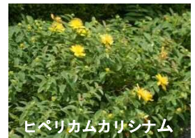
ヒペリカムカリシナム

瀬戸大府東海線歩道の植樹帯、区画道路のアイストップに、ヒペリカムカリシナムを植栽します。